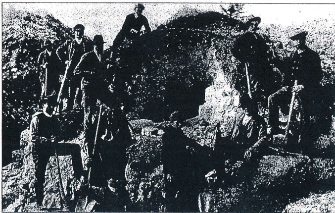
Mitglieder des Schörzinger Albvereins bei Ausgrabungsarbeiten auf dem Oberhohenberg im Jahr 1913