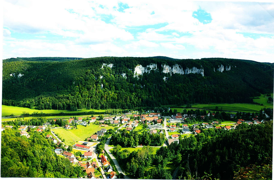
Wunderschöner Blick von der Burg Hausen auf den Ort Hausen im Tal