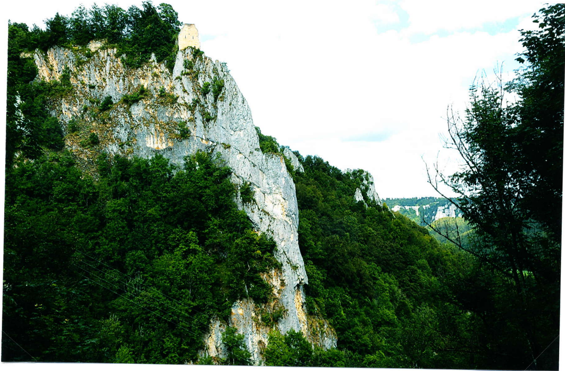
Dieselbe Mauerruine des Wohnturmes vom Tal aus gesehen