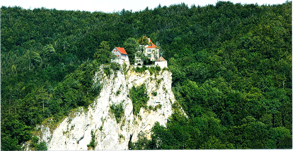
Blick auf Schloss Bronnen vom Knopfmacherfels bei Fridingen