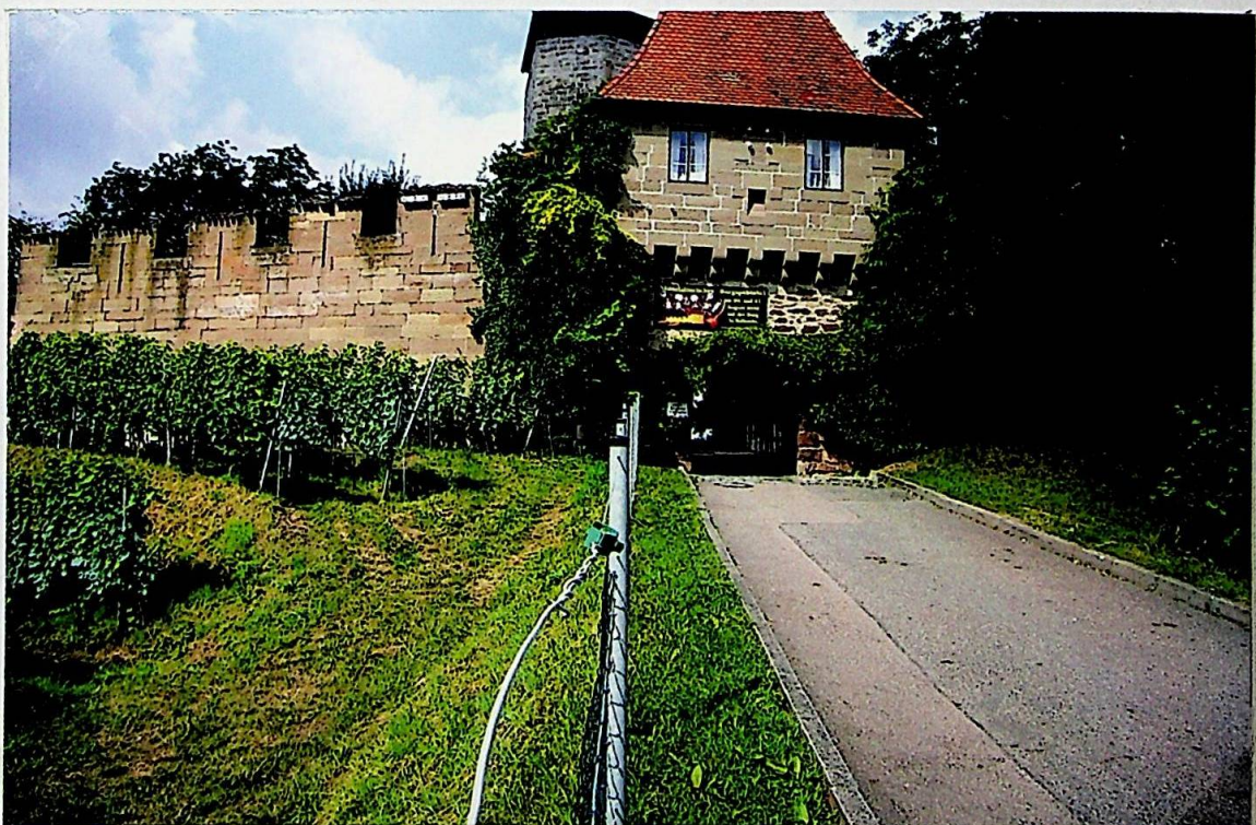
Der heutige Eingangsbereich der Burg Hohenbeilstein

Und nun zeigen wir noch zwei Bilder vom heutigen Zustand der Burg.