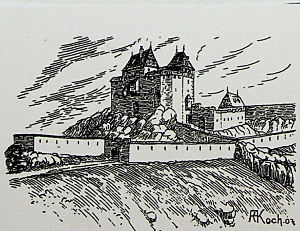
Pfannenstiel (mutmaßliches Bild von Westen).

Auch diese Burg hatte zwei Eingänge und zwar führte der erste mit einer Zugbrücke über den Burggraben zuerst in den Vorhof, während der zweite Eingang durch den Graben erst links, dann gegen Westen führt um wieder in östlicher Richtung in die Vorburg einzumünden. Gegen Westen sieht man noch Mauerspuren eines weiteren Vorwerks oder Zwingers (G). An den bisher veröffentlichten Grundrissen wurde diese Anlage übersehen. Auch ist fast mit Sicherheit anzunehmen, daß beide Gräben mit Außenmauern verbunden waren (im Grundriss punktiert). Im Westen bildet der Abschluß einen quer über den Bergrücken gezogenen Wall mit Graben. Erst in diesem Grundriß ist der ganze Umfang der Burg ersichtlich. Und wie die Burg ausgesehen haben könnte, zeigt dieses Bild.