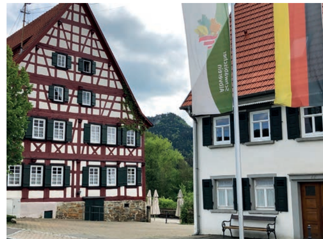
Haus der Volkskunst

Zwei vom Abriss bedrohte, stattliche Bauernhäuser haben wir mit Jugendlichen ab 1980 in mehr als 20.000 Stunden Eigenleistungen zu einem Jugendhaus und Zentrum für Schwäbische Kultur umgebaut. Internationale Jugendbegegnungen bringen junge Künstler, die der traditionellen Kultur ihres Landes verbunden sind, in das Haus. Zusammen mit jungen Schwaben wird traditionelle Volkskunst gelebt, bewahrt und gezeigt. Der völkerverbindende Aspekt dieses seit 40 Jahren jährlich stattfindenden Jugendaustauschs ist sehr beachtlich.