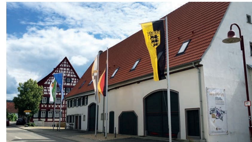
Die Schlafräume sind auf beide Häuser verteilt.

Für viele der 85.000 Mitglieder des Schwäbischen Albvereins ist das Haus ein Wanderstützpunkt und wichtiges Kultur- und Informationszentrum. Die Gastwirtschaft wird von Kennern der regionalen, schwäbischen Küche sehr geschätzt. Durch die vielen praktischen, großen Räume und durch den gut geführten Übernachtungsbetrieb, ist das Haus ein wunderbarer Platz für Pro-